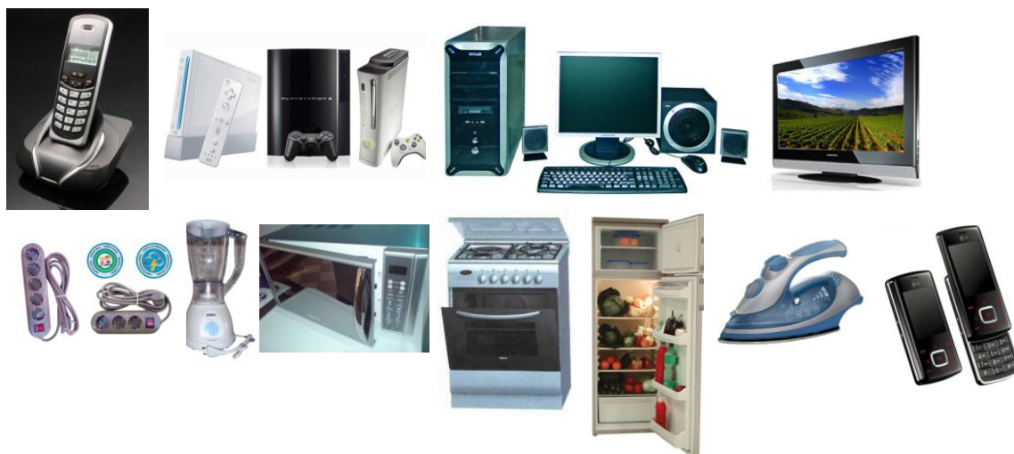
Слика 2. Извори нејонизујућих зрачења у домаћинству

У стамбеном простору срећемо најразличитије изворе нејонизујућих зрачења: бежичне телефоне, компјутере, конзоле за „РС“ игре, телевизоре, пегле, микроталасне пећнице, продужне каблове, електричне шпорете, фрижидере, замрзиваче и све остале електричне уређаје.