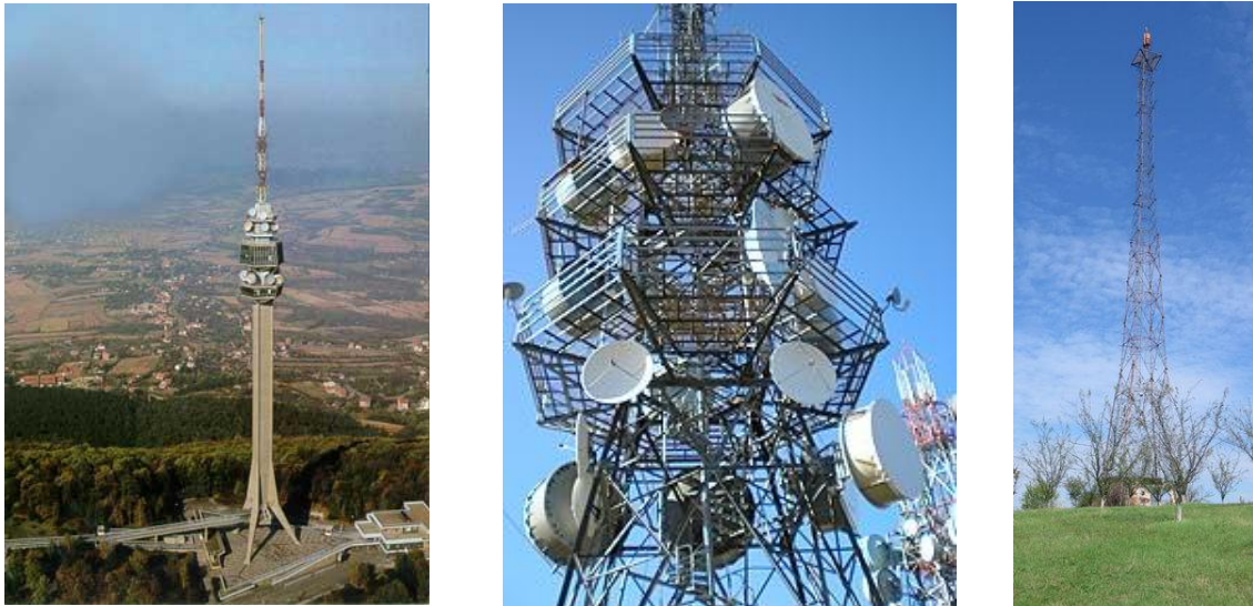
Слика 5. ТВ и радио репетитори