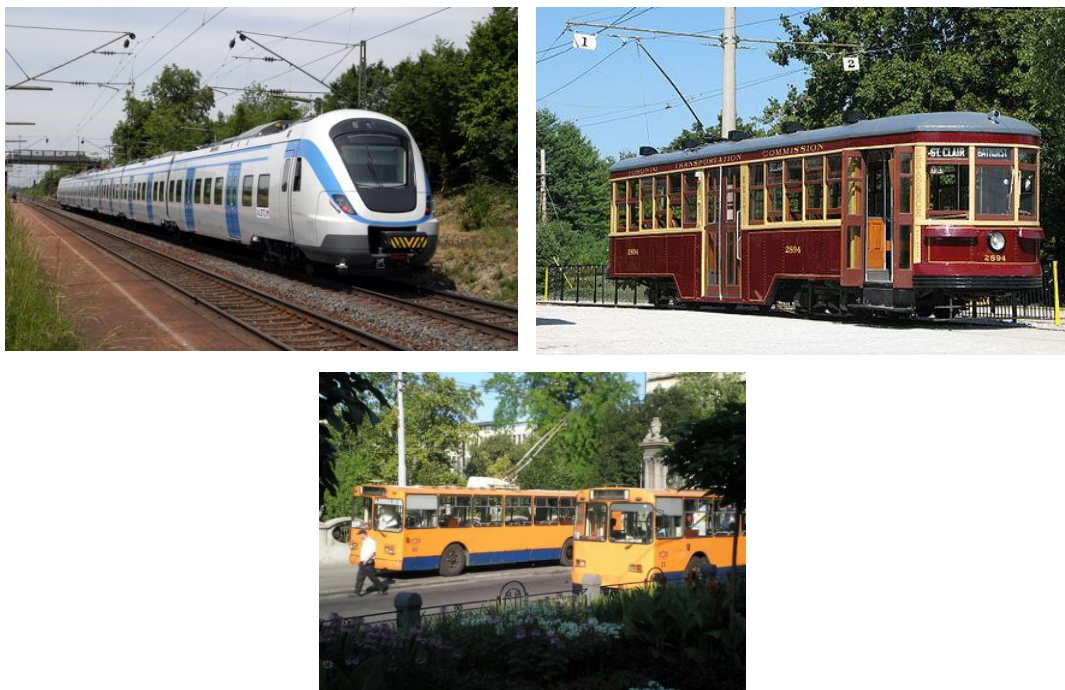
Слика 4. Извори нејонизујућих зрачења у саобраћају