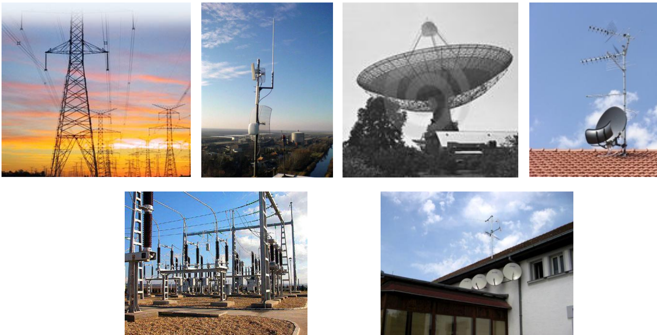
Слика 3. Извори нејонизујућих зрачења у животној средини

У животној средини такође срећемо најразличитије изворе нејонизујућих зрачења. Ту се убрајају далеководи, кабловска и сателитска комуникација, трафостанице, саобраћајна превозна средства која користе електричну енергију (електрични возови, трамваји и тролејбуси), ТВ и радио репетитори. У изворе нејонизујућих зрачења убрајају се и базе станице мобилне телефоније које су постале последњих година актуелне брзим развојем мобилне телефоније.