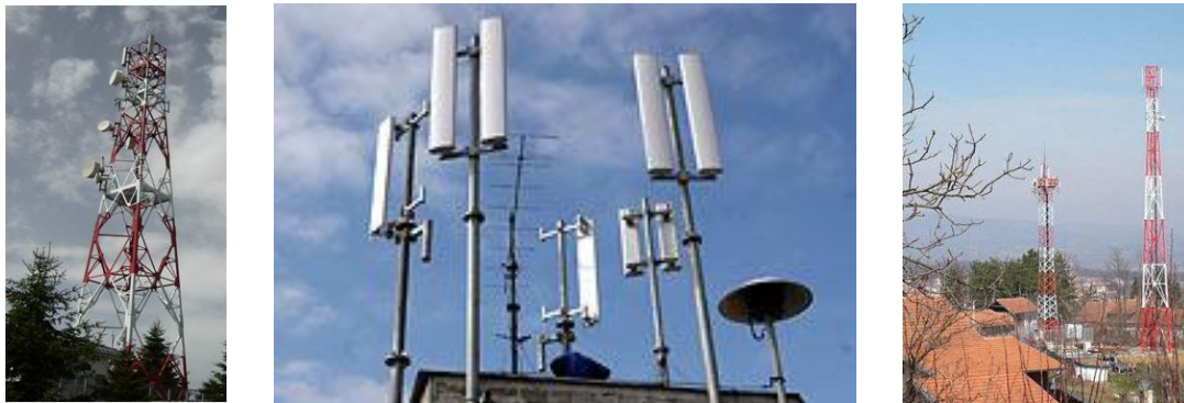
Слика 6. Базне станице мобилне телефоније